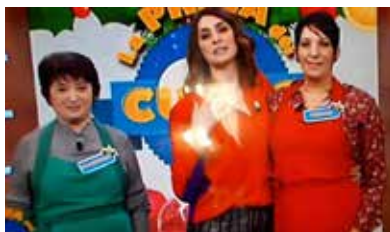
Rai 1 Palmerina alla "Prova del cuoco"