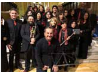
Concerto di Natale